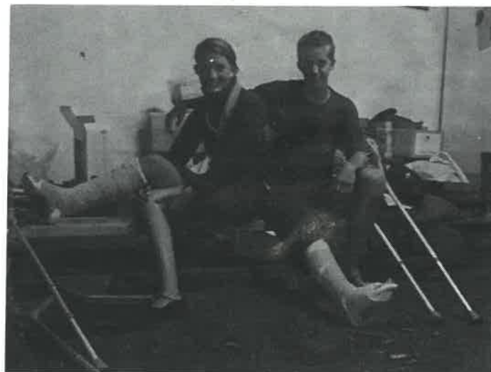
Wir werden euch vermissen!

Starreporter und Wichtelführerin bei gefährlichem Einsatz verletzt